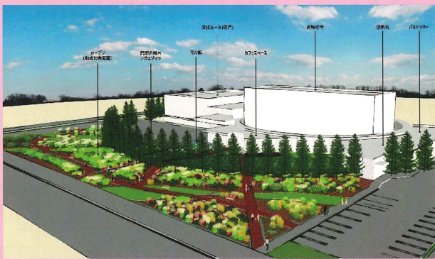
第34回 都市緑化機構賞 北海道東神楽町