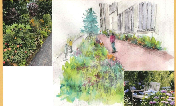
第34回 国土交通大臣賞 新潟医療福祉大学社会福祉学部社会福祉学科原口ゼミ

日常的花や緑の活動を通して、地域の活性化や子どもたちへの情操教育、身近な環境の改善に寄与するプランを募集します。